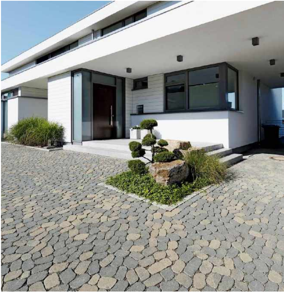
Die stark horizontal gegliederte Fassade trifft auf die richtungslose Verlegung der ARENA®-Steine auf dem Boden.