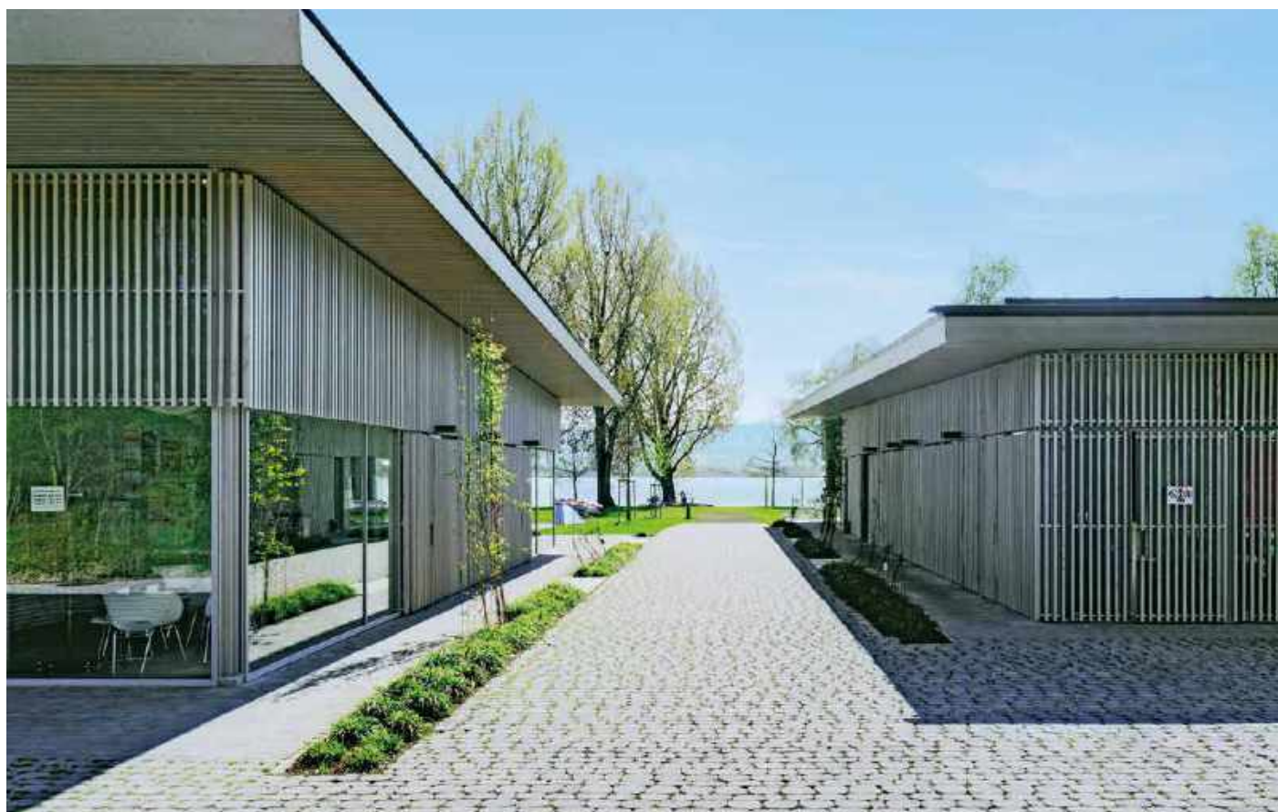
Naturnahe Anmutung, perfekter Lauf- und Fahrkomfort.

Wo Mensch und Natur aufeinandertreffen, ist es wichtig, dass beide Seiten gewinnen. Als der Campingplatz Hegne im Konstanz-er Ortsteil Allensbach modernisiert werden sollte, war ein sensibler Umgang mit der artenreichen Natur gefordert. In der abwechslungsreichen Uferlandschaft des Wollmatinger Rieds am Bodensee blüht und flattert, krabbelt, schwebt und zwitschert es. In dem Naturschutzgebiet gedeihen etwa 600 verschiedene Farn- und