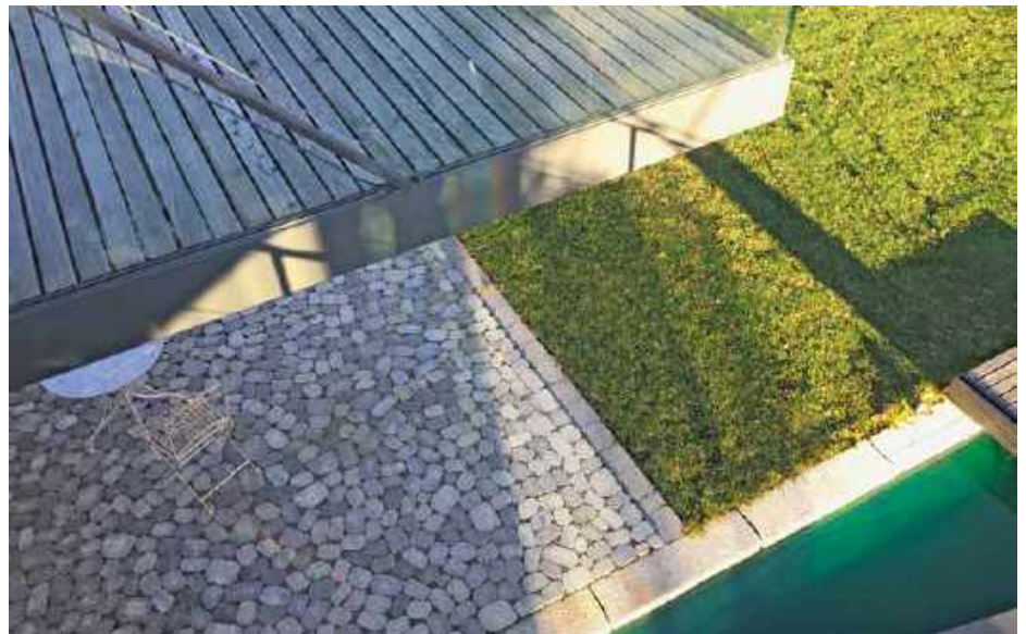
Oase: ARENA®-Pflastersteine sind das verbindende Element zwischen Wasser, Grün und Form.

Es muss gar nicht kompliziert sein. Keep it simple: Zen macht diese Einfachheit zum Prinzip. Mit Sorgfalt und Wertschätzung sind die Dinge platziert und die Gedanken ausgerichtet. Im Garten werden Wege, Plätze und Rückzugsorte mit Bedacht festgelegt. Das Ideal der Klarheit, Leere und Ausrichtung trieb die Gartengestalter bei diesem Projekt an. Dieser Garten strahlt eine leise Ordnung aus. Wie wird das erreicht? Orientierung entsteht durch Perspektive, Ruhe durch Sammlung. Der Fokus ist auf den Ort gerichtet, in dem der Mensch zur Ruhe finden kann. Der Blick wird geleitet durch linearperspektivische Elemente wie Hecken, Gräser, Schilf und führende Begrenzungselemente. Ruhe und Sammlung entstehen durch die bewusst gewählte ungerichtete Bodengestaltung mit dem ARENA®-Pflasterstein. Organische Steinformate mit ihren natürlich anmutenden Formen und der daraus entstehenden Lebendigkeit sind der Boden. Mensch und Natur sind im Fluss. Daraus ergeben sich vielfältige Kombinationsmöglichkeiten.