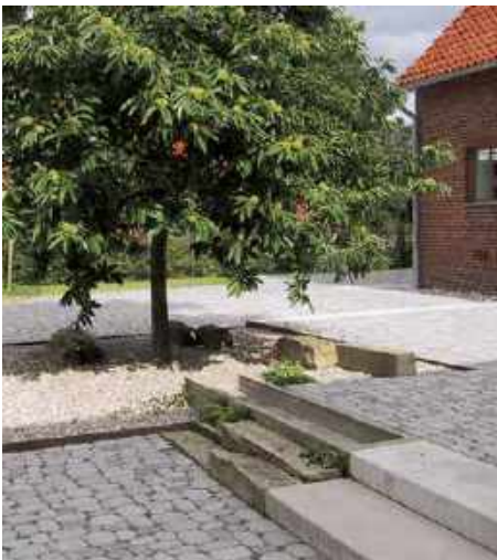
ARENA®: Auch seine ökologischen Qualitäten sind wegweisend.