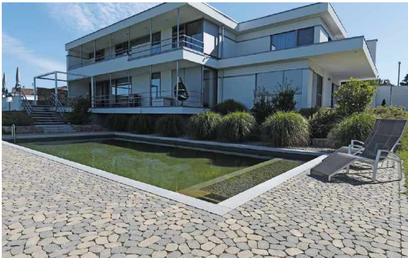
Richtungskontrast: Architektur gerichtet, Pflasterbelag ungerichtet.