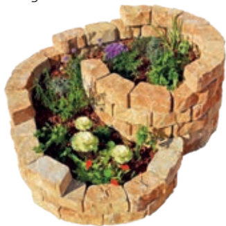
Grundfläche: ca. 1,80 x 1,30 m

Für den Aufbau der Landhaus Kräuterschnecke - Bausatz 1 benötigen Sie eine Grundfläche von ca. 1,80 m x 1,30 m. Der Aufbau erfolgt abgestuft. Dazu werden 100 Landhaus Trapez-Mauersteine (1 Verpackungseinheit = 1 Paket) benötigt. Diese werden auf Kombipalette geliefert. Sie erhalten eine kostenlose Aufbauschaablone der 1. Lage.