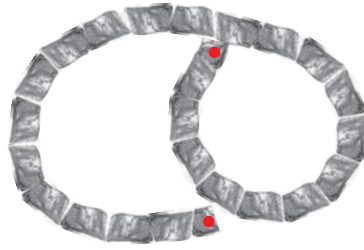
2. Lage: Höhe: 20 cm 23 Steine +2 halbe Steine