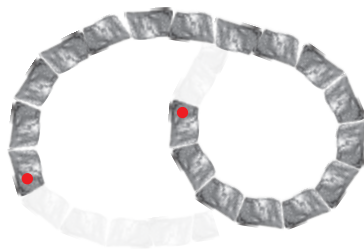
4. Lage: Höhe: 40 cm 18 Steine