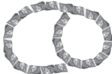
1. Lage: Höhe: 10 cm 24 Steine