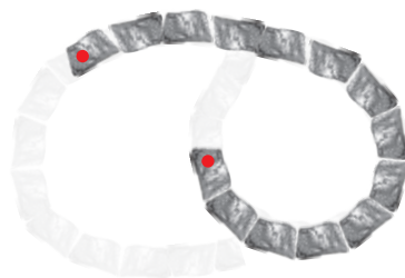
5. Lage: Höhe: 50 cm 14 Steine